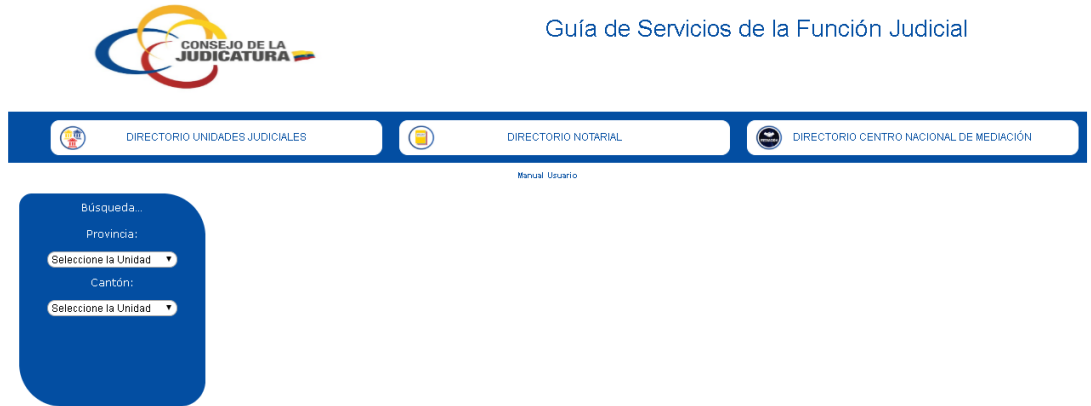
Imagen 3. Pantalla de Opciones Guía de Servicios de la Función Judicial.

3. Después se presentaran las opciones de sistema Guía de Servicios de la función Judicial.