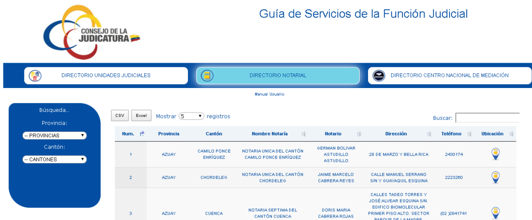
Imagen 6. Filtrado Directorio Notarial.

Las opciones de Búsqueda, que permiten identificar por Provincia, Cantón y Nombre de la Notaria. Son con texto predecible es decir que se filtrara según las palabras escritas.