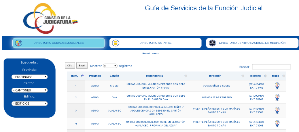
Imagen 4. Filtrado Unidades de la Función Judicial.

Las opciones de Búsqueda, que permiten identificar por Provincia, Cantón, Edificio y Nombre de la dependencia. Son con texto predecible es decir que se filtrara según las palabras escritas.