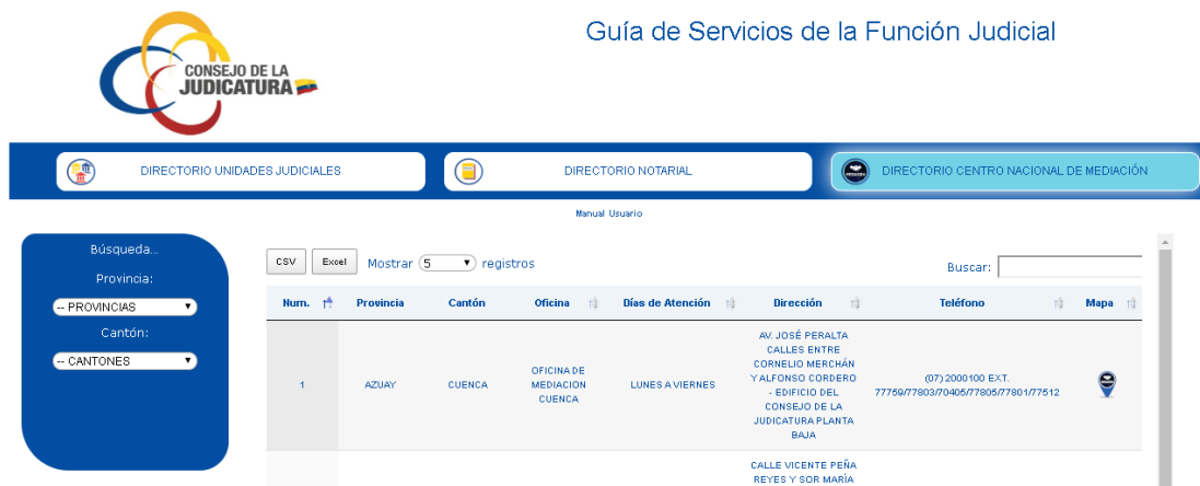
Imagen 8. Filtrado Centros de Mediación.

Las opciones de Búsqueda, que permiten identificar por Provincia, Cantón y Nombre de la Notaria. Son con texto predecible es decir que se filtrara según las palabras escritas.