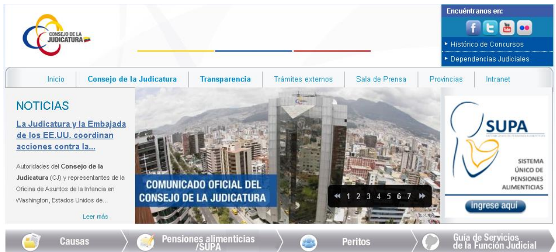
Imagen 1. Web de la Función Judicial.